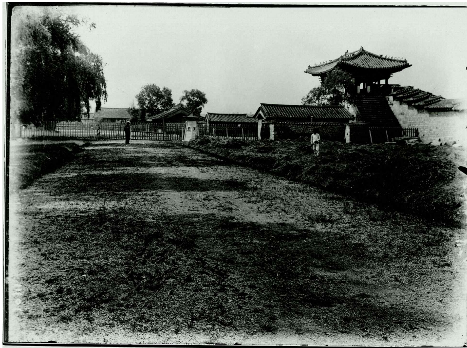
<1920년대 영추문 모습(서울대학교박물관)>