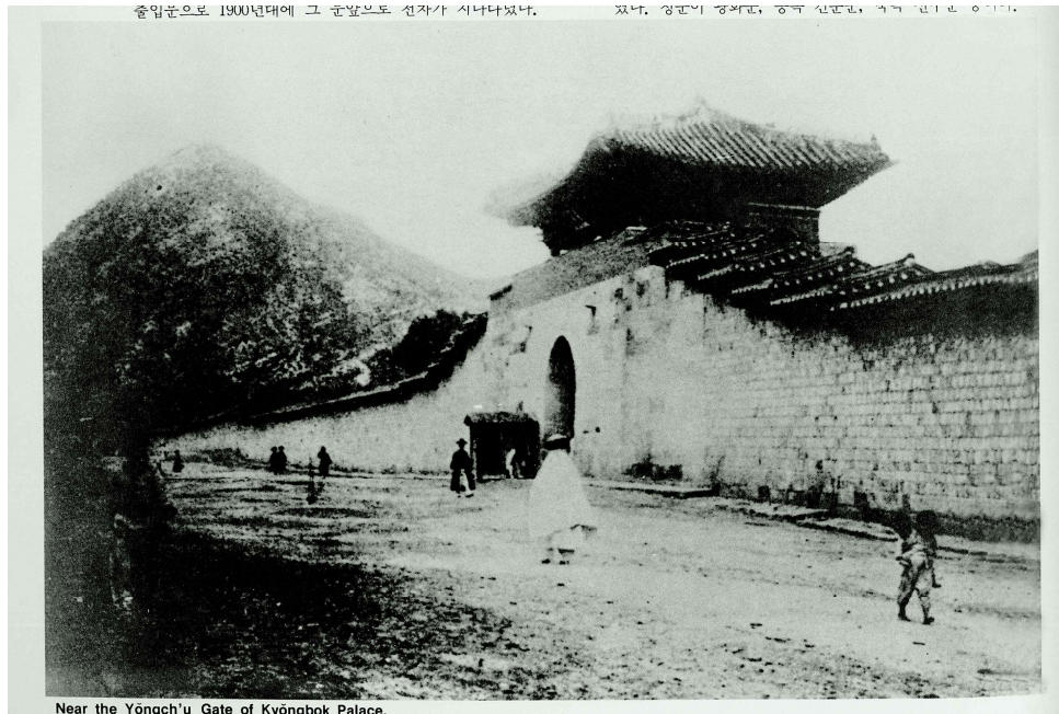
<1900년대 경복궁 서문 영추문>