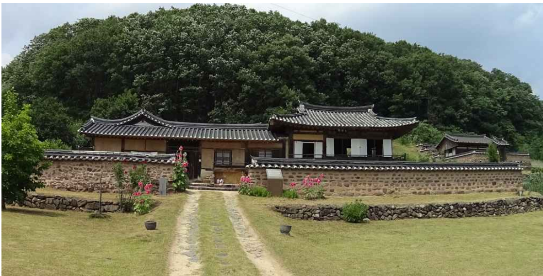
<본채 정면 전경>