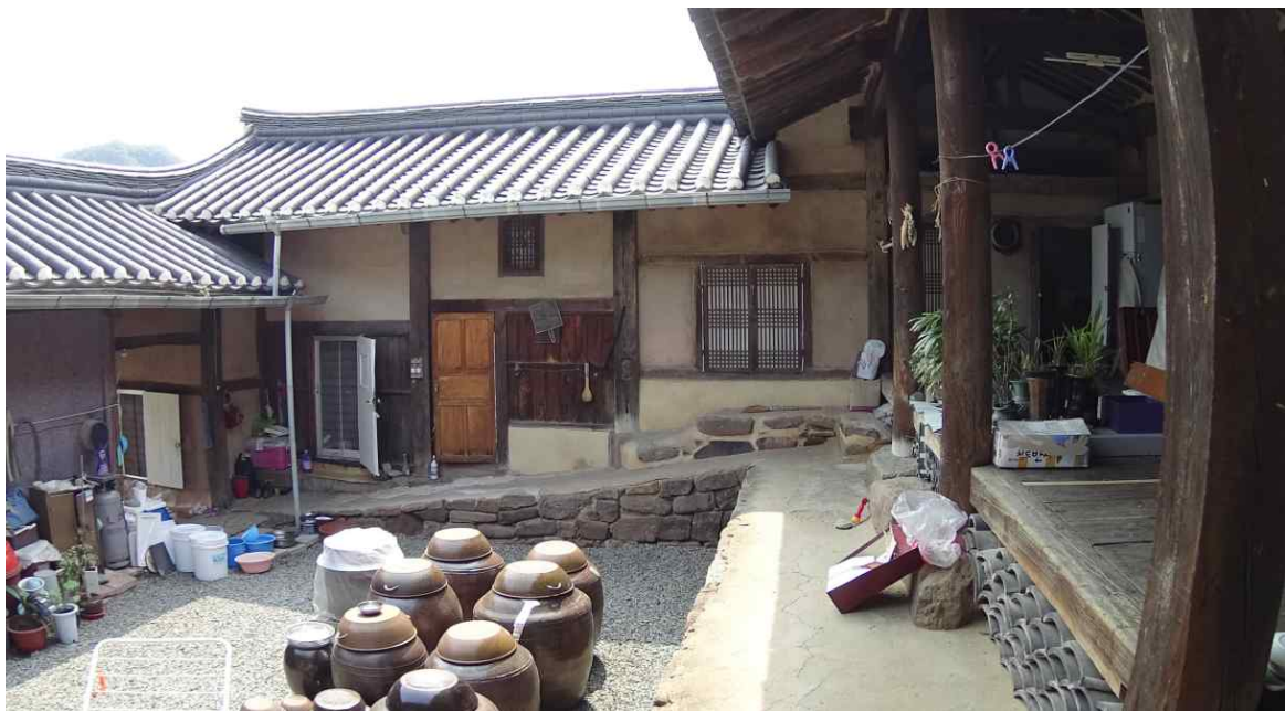
<본채(안채 영역 왼쪽과 정면) 내부>