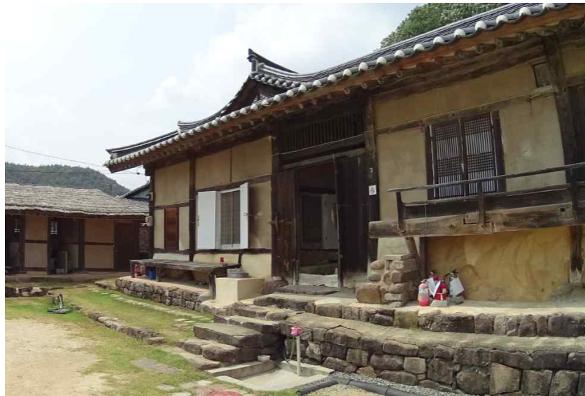
<방앗간채와 본채(중문간 영역) 외부 전경>