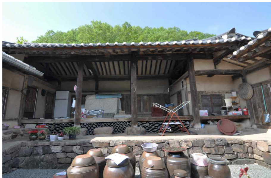
<본채(안채 영역 정면) 내부>