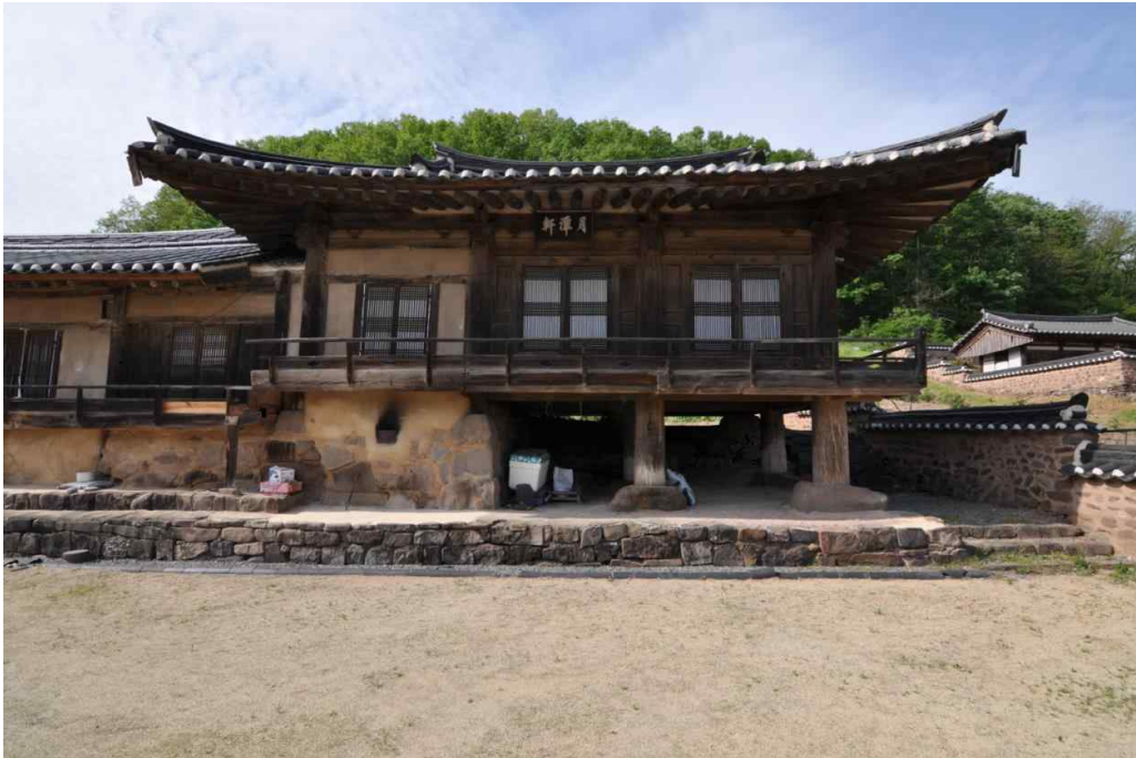
<본채 사랑 영역>