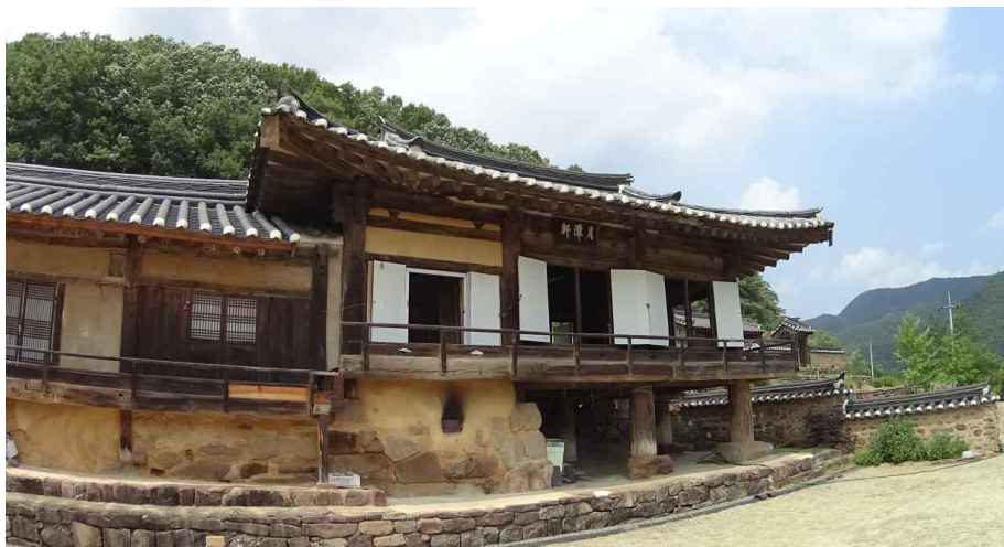
<본채(사랑 영역) 정면>