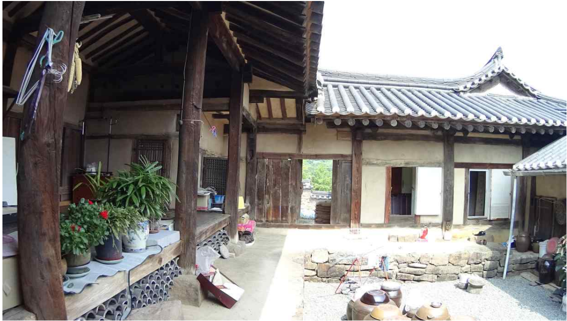
<본채(안채 영역 정면과 오른쪽)>