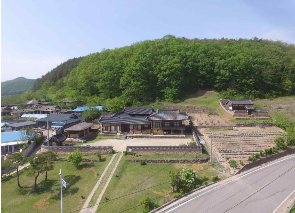
<영양 한양조씨 사월 종택 전경>