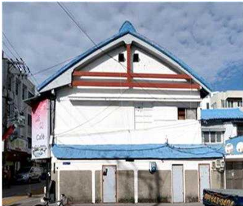
〈국가등록문화재 제801호 경상남도립 나전칠기 기술원 양성소〉