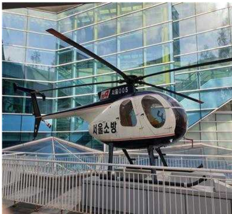
〈소방 헬기 ‘까치 2호’〉