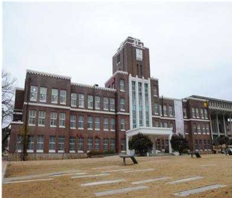
〈국가등록문화재 제802호 전남대학교 용봉관〉