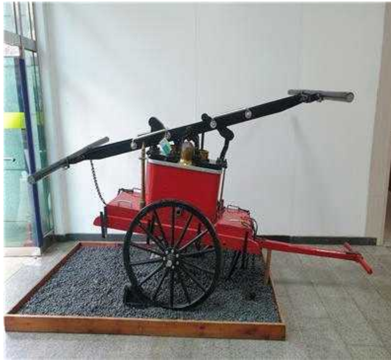
〈국산 소방 완용 펌프〉