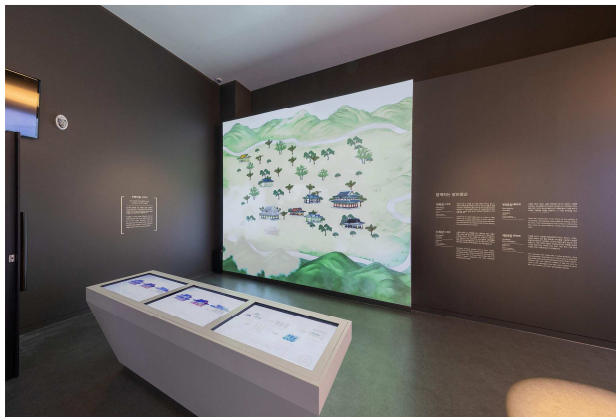
무형유산디지털체험관 '무형마을 꾸미기' 체험