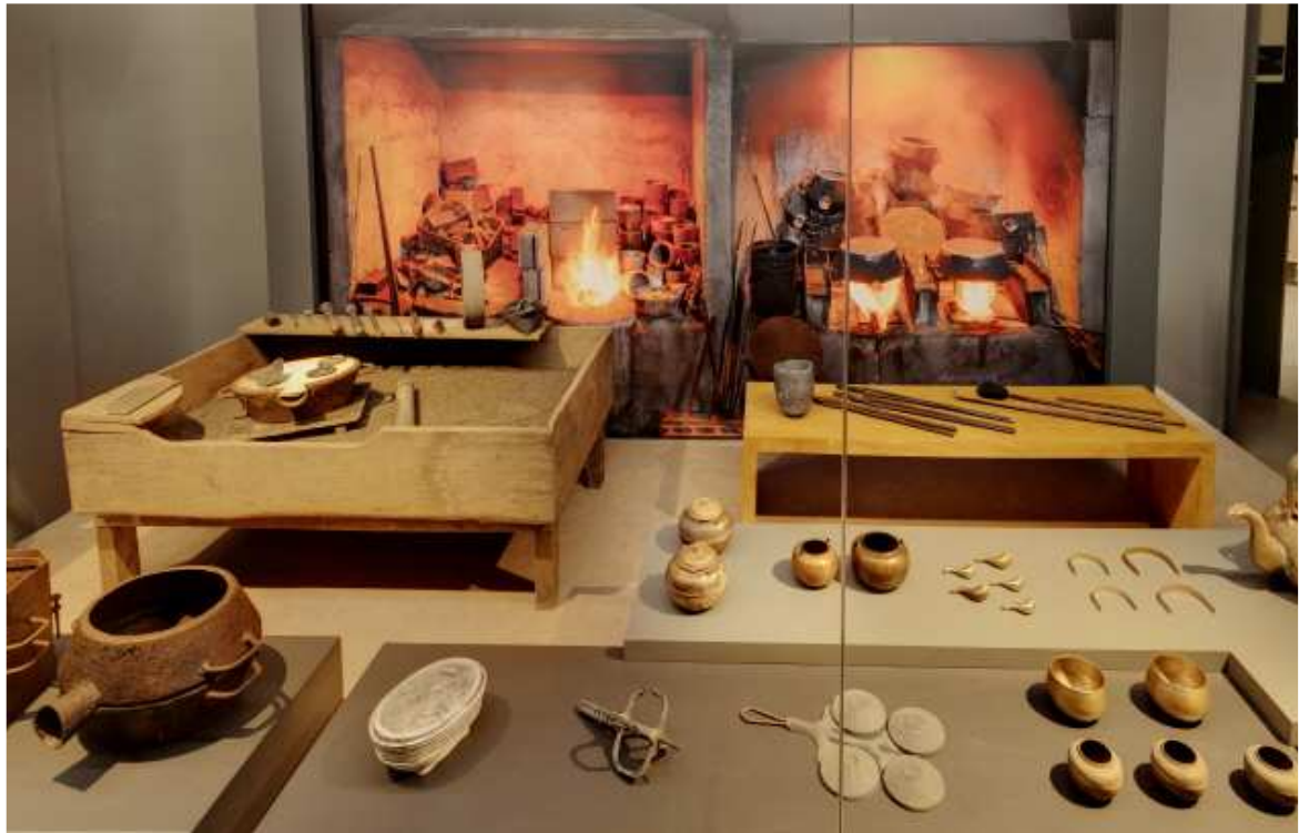
제2 상설전시실 '유기 공방'