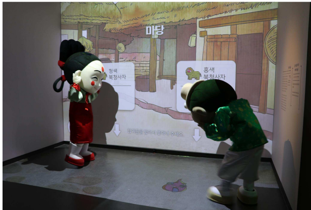
무형유산디지털체험관 '복청사자놀이' 체험