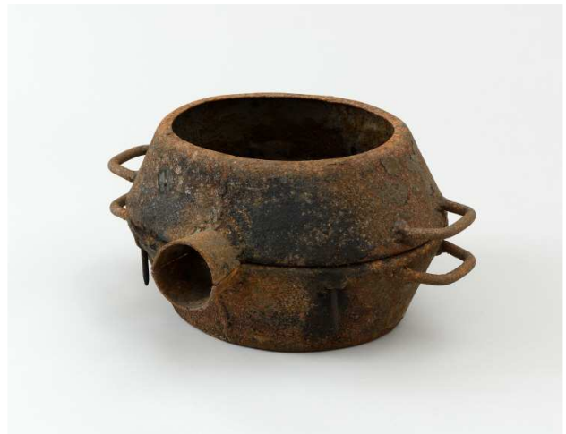
제2 상설전시실 '향남틀', 유기장 작고 보유자 김근수, 2014년, 38.0×48.0×24.0cm, 국립무형유산원 소장