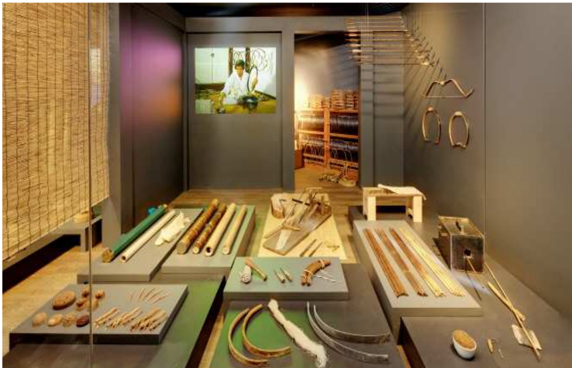
제2 상설전시실 '궁시장, 전통장 공방'