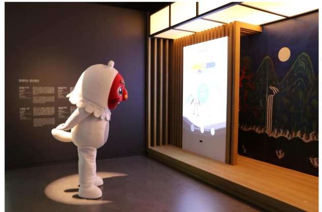
무형유산디지털체험관 '학연화대합설무' 체험