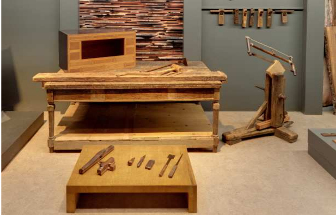
제2 상설전시실 '소목 공방'