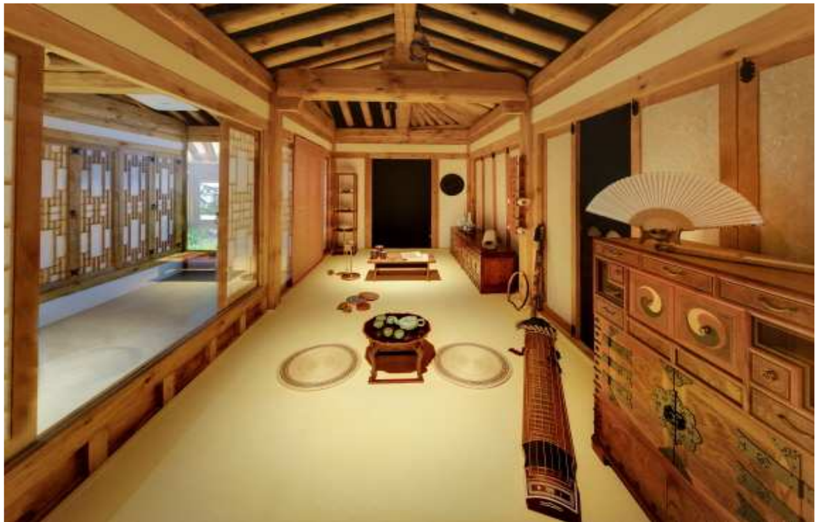
제2 상설전시실 '사랑방'