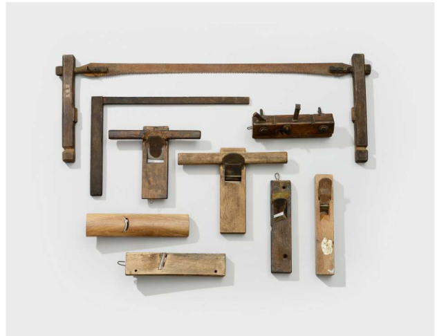
제2 상설전시실 '소목 제작 도구' 소목장 작고 보유자 천상원, 국립무형유산원 소장