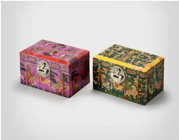
제2 상설전시실 '화각보석함' 화각장 보유자 이재만, 2017년, 15.0×24.0×15.0cm, 국립무형유산원 소장