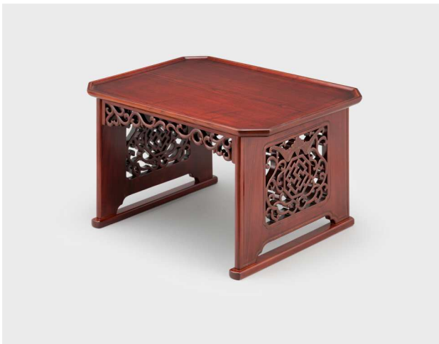
제2 상설전시실 '해주반' 소반장 작고 보유자 이인세, 2000년, 37.0×50.0×30.0cm, 국립무형유산원 소장